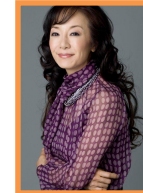
キャスター・エッセイスト 南 美希子さん

1977年4月テレビ朝日アナウンサー部に入社。1986年12月独立し、個人事務所を開設。キャスター・エッセイストに。