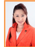
衆議院議員 三原 じゅん子さん

スバのプロデュースなども手がけ、日々新たなビューティ・ポディケアのスタイルを追求中。