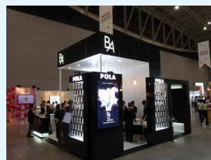
化粧品ブースイメージ

「Beauty」「Health」「Travel」の各ZONEでは、「若々しく、楽しく生きる」ための情報が満載です。新商品のサンプリングや各種体験コーナーなどをお楽しみいただけます。