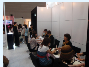
体験ブースイメージ